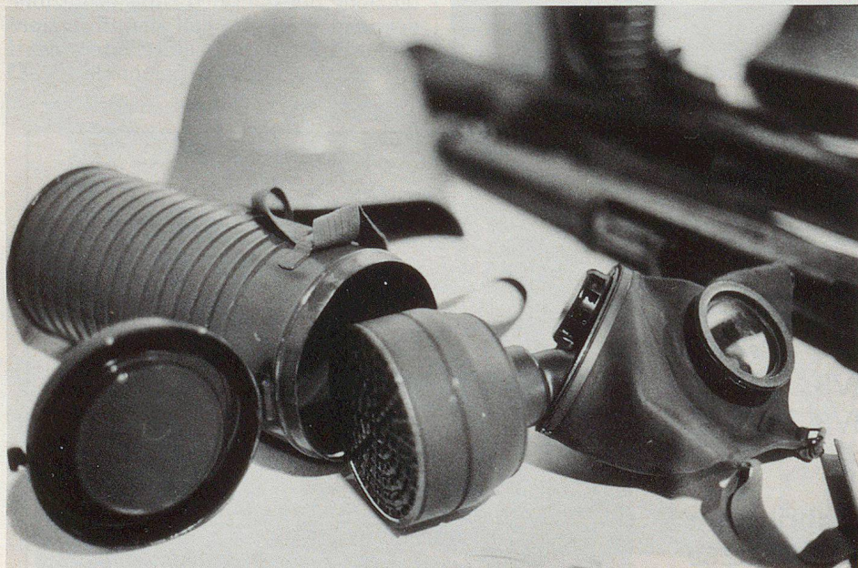
Gasmaske für die Zivilbevölkerung, wie sie 1941 in Gebrauch war.

Die Zivilbevölkerung wurde aufgefordert, sich mit Gasmasken einzudecken, die zu einem reduzierten Preis erhältlich waren.