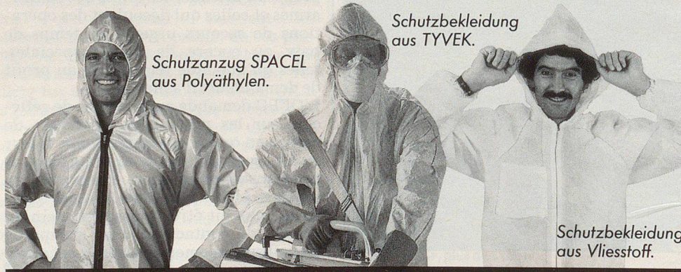
Schutzanzug SPACEL aus Polyäthylen.