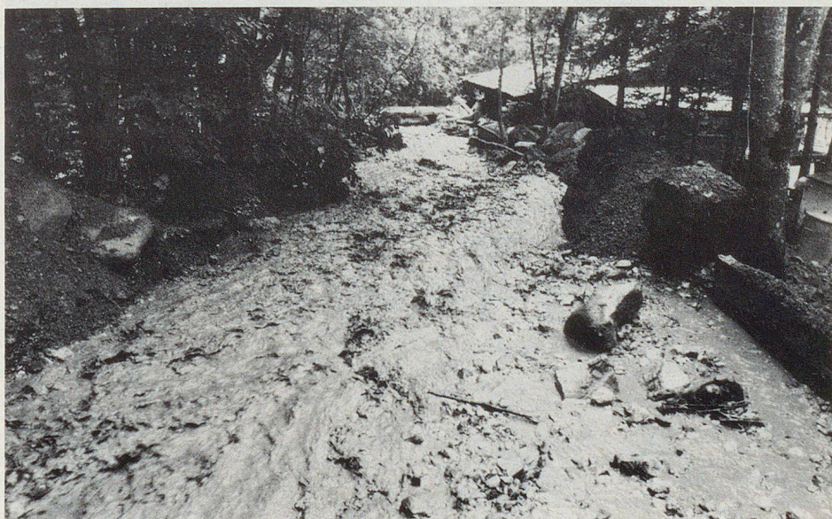
Überbordeter Sandbach: Das sonst so friedliche Bächlein brachte massenhaft Geschiebe zu Tal.

Die Schäden im Wärgistal ob Grindelwald-Grund waren auf ein heftiges Hagelgewitter zurückzuführen, das sich einen Monat zuvor – am 17. August – am Eiger entladen hatte. Niemand im Gletscherdorf mag sich erinnern, dass dort einmal ein ähnlich starkes Unwetter niedergegangen wäre. «Von blossen Auge hat man die Sturzbäche am Eiger beobachten können», weiss Gemeinde-