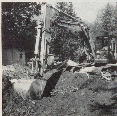
Auf dem Campingplatz: Ablaufmöglichkeiten schaffen, um eine weitere Überschwemmung zu vermeiden.