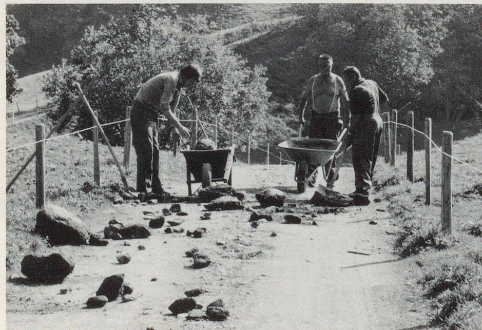
Sanierungsmassnahmen: Wege- und Skipistenpassagen freilegen.

rat Hermann Märkle zu berichten. Innert Minuten suchten sich die Wassermassen neue Wege. Als nach einer Viertelstunde der Spuk vorbei war, herrschte auf dem Campingplatz Sand im Delta des Sandbachs ein einziges Chaos. Die meisten Leute waren beim Nachtessen überrascht worden. Im aufgestauten Wasser herumwaten mussten sie feststellen, dass die Zufahrtsstrasse eingebrochen und damit ein Entrinnen unmöglich geworden war.