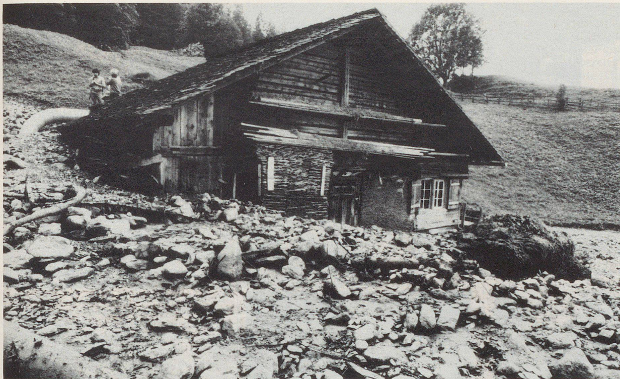
Zerstörtes Kulturland: Weitherum wurden Steine und Holztrümel abgelagert.

Viertägiger Nothilfe-Einsatz des Grindelwaldner Zivilschutzes