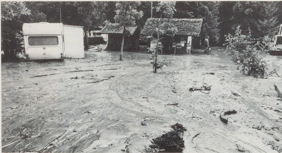
Campingplatz «Sand»: Innert weniger Minuten ein Bild der Verwüstung.