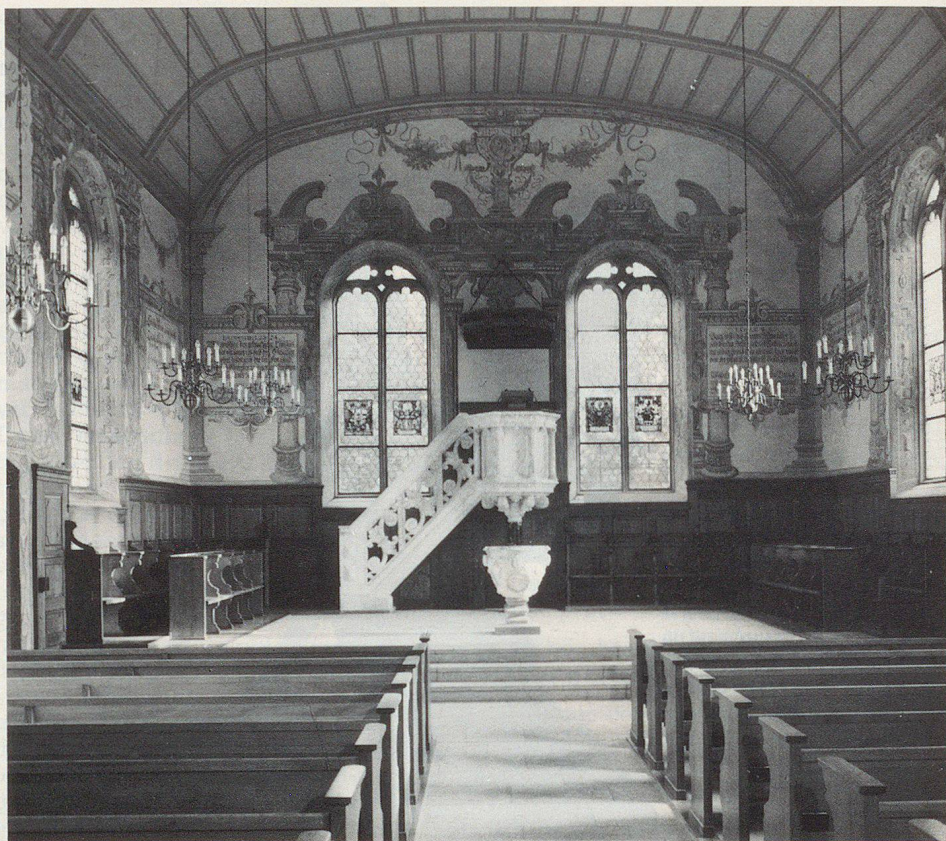
L'église réformée de Gränichen, construite entre 1661 et 1663 par Abraham Dünz, peut être considérée comme un prototype de salle de prédication de Berne. Le baptistère et la chaire d'albâtre blanc doivent pouvoir être protégés sur place.

Les responsables cantonaux avaient par ailleurs manifesté beaucoup de scepticisme s'agissant de faire dresser les inventaires par des personnes non professionnelles. C'est pourquoi l'on a voué une attention particulière à cette question dans les programmes de cours et dans les documents de travail, ce qui