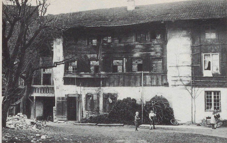
Della cittadina di Meienberg nel Freiamt (oggi comune di Sins) ci è rimasta solo la sede di uffici, testimonianza di una comunità nel 13° secolo. Le foto mostrano lo stato precedente e quello successivo al restauro avvenuto nel 1953.