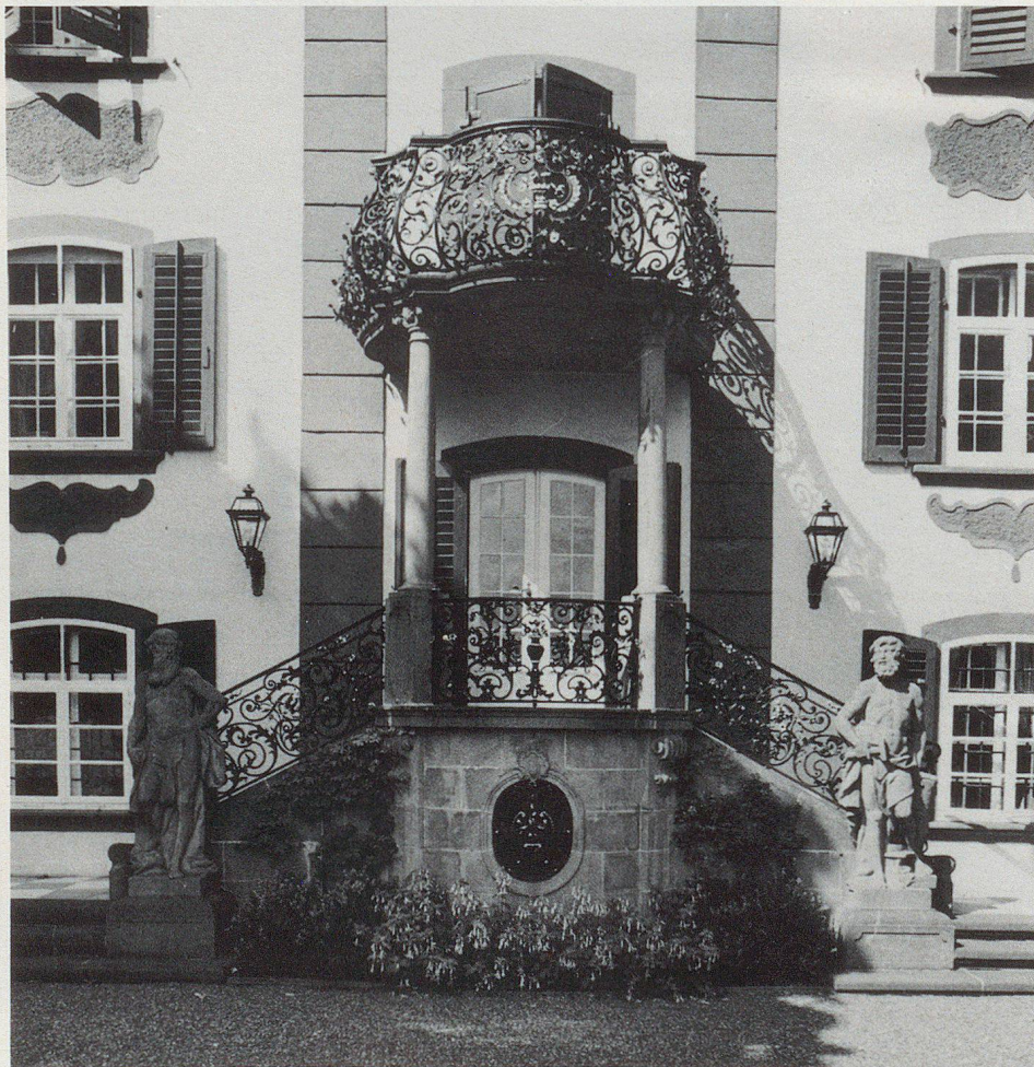
Molte case di ricchi borghesi testimoniano l'amore per l'arte dei loro costruttori. La casa barocca «zur Linde», costruita nel 1764, venne completata nel 1918 da una scala all'aperto, una balaustra in ferro battuto e due statue in piena armonia con il suo stile.

Vista dall'insieme più vasto della protezione civile, la protezione dei beni culturali è un servizio speciale piuttosto piccolo. La più piccola formazione è formata di due persone, mentre nelle città e nelle grandi organizzazioni di protezione possono essere anche più di una dozzina di specialisti. Anche se il fabbisogno di personale è senz'altro controllabile, non si riesce sempre a incorporare persone idonee o a rilevarle da altri servizi. Per questo siamo lieti del fatto che i programmi d'istruzione e i documenti disponibili ammettano un vasto spettro di personale da reclutare. ▽