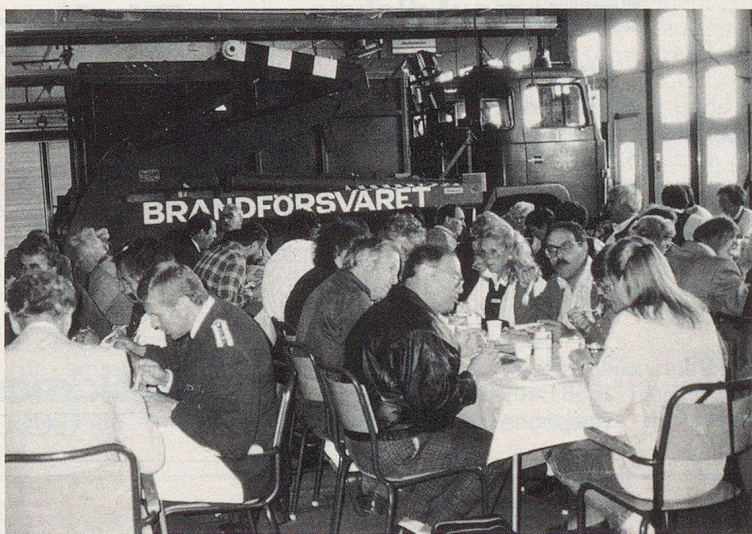
Le repas de guerre servi à l'intérieur de locaux techniques ultra-modernes (Centre de formation d'Uppsala en voie d'achèvement).