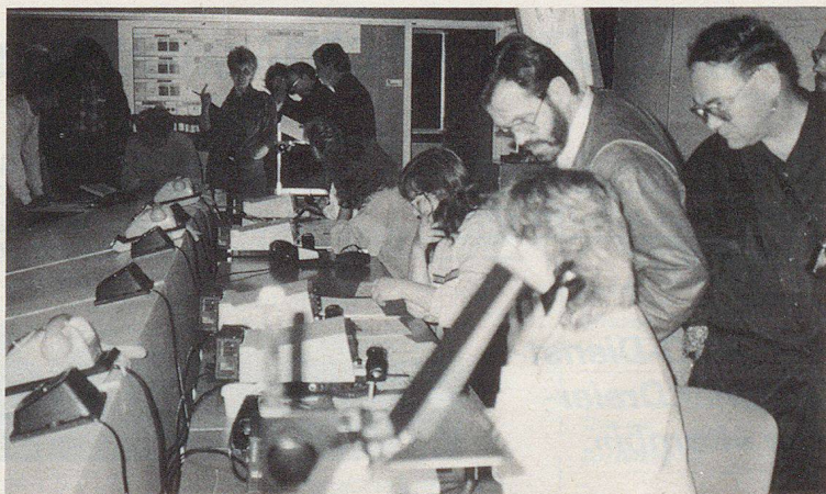
Une démonstration des plus intéressante d'un cours combiné d'état-major.