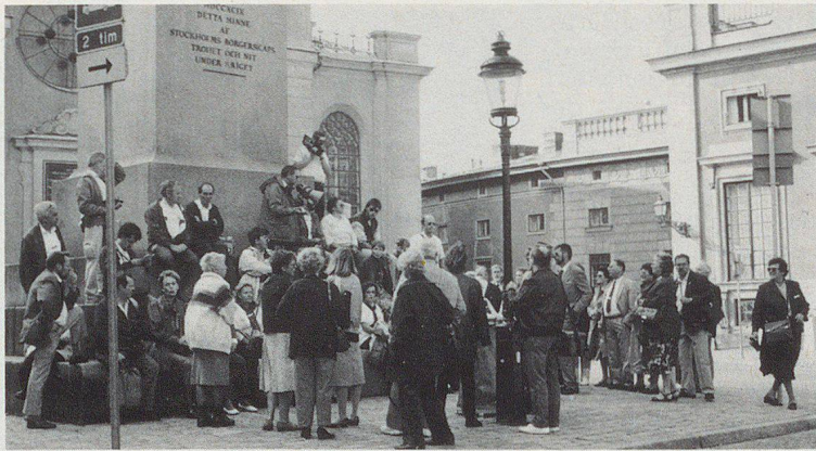
Un groupe attentif aux explications lors de la visite «Gamla Stan» (vieux Stockholm).

Le voyage de retour s'est effectué dans les meilleures conditions, chacun retrouvant son foyer et, selon une formule en usage dans le comité de l'AIRPC, «prêt pour de nouvelles aventures». ▣