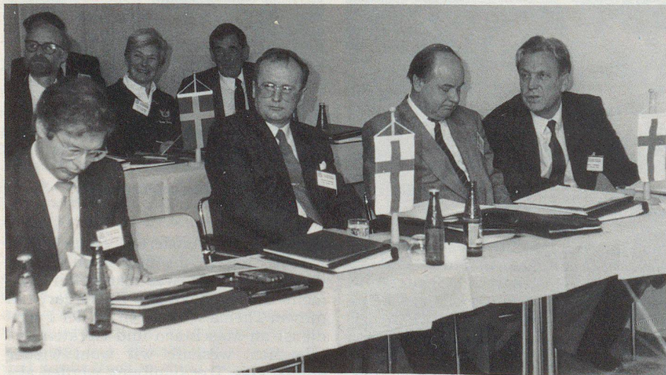
Die finnische Delegation (Vordergrund) und die schwedische (Hintergrund).

Der Vertreter des schwedischen Zivilverteidigungsverbandes hob die grosse Verantwortung der Gemeinde hervor, die als zentraltragende Zivilschutzsäule neu aufgewertet wurde. Wie so viele andere Dinge in Schweden, führte Ekeblom aus, wurde die Zivilverteidigung in den sechziger Jahren zentralisiert und verstaatlicht, um mehr Effizienz zu erreichen. Im Jahre 1987 kam man wiederum auf die Gemeinde zurück, die für das Überleben ihrer Einwohner im Kriege wie in Friedenszeiten verantwortlich ist. Man beschloss, dass der kommunale Rettungsdienst auch