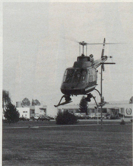
Der Strahlenspür-Heli des österreichischen Forschungszentrums Seibersdorf.