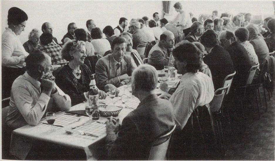
Les membres de l'AI RPC à l'heure du repas et de la détente.

compte tenu du très important travail d'organisation que demande la mise sur pied d'une telle manifestation. Les finances de l'association sont saines. Le capital est de 7492 francs et le bénéfice