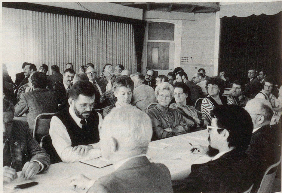
Une partie de l'assemblée durant les débats.