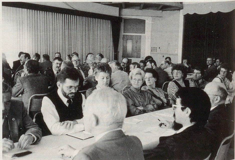
Une partie de l'assemblée durant les débats.