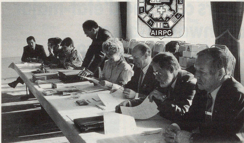
Toute la Suisse romande est représentée au sein du comité.