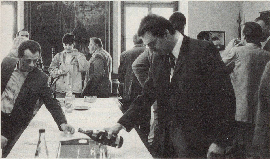
Le vin d'honneur offert par la Municipalité de Delémont à l'Hôtel de ville.