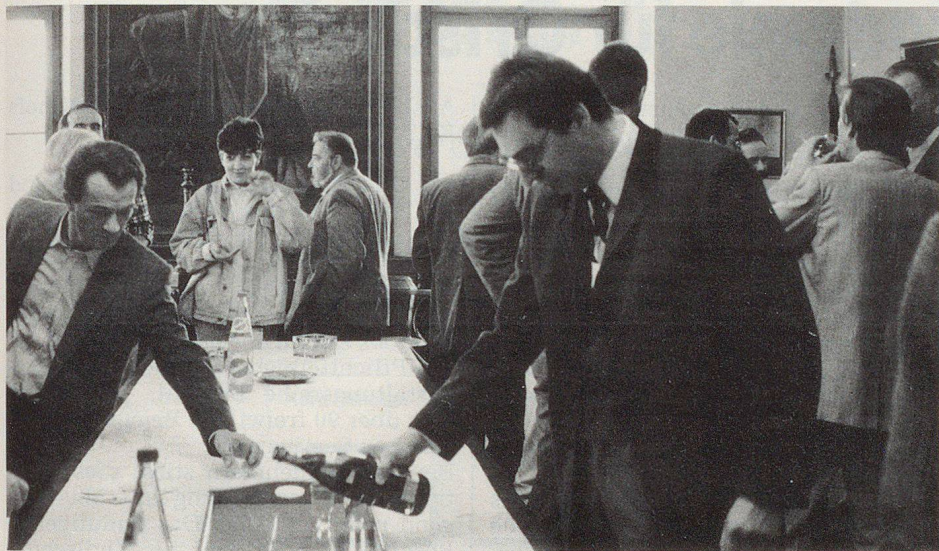
Le vin d'honneur offert par la Municipalité de Delémont à l'Hôtel de ville.