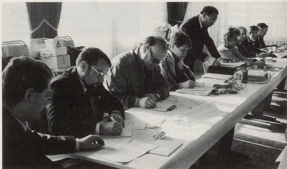
Un comité studieux et attentif.