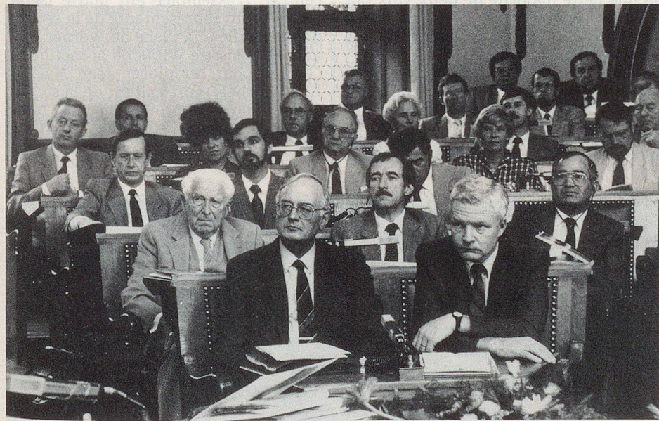
Auch prominente Gäste verfolgten mit Interesse den Lauf der Tagung.

Er bezeichnete im weiteren die Tatsache, dass mit der Herabsetzung des Dienstalters in der Armee auch die Zivilschutzbestände zurückgehen werden und warnte davor, die Reform 95 allenfalls in eine Verschlechterung der heutigen Regelung des Offiziersübertritts in den Zivilschutz ausmünden zu lassen. Er nannte eine Staffellung aller Neuregelungen für den Zeitraum von zwei bis drei Jahren als absolut notwendig, um Schwierigkeiten zu vermeiden. Als ganz persönliche Meinung vertrat er die Haltung, dass die Re-