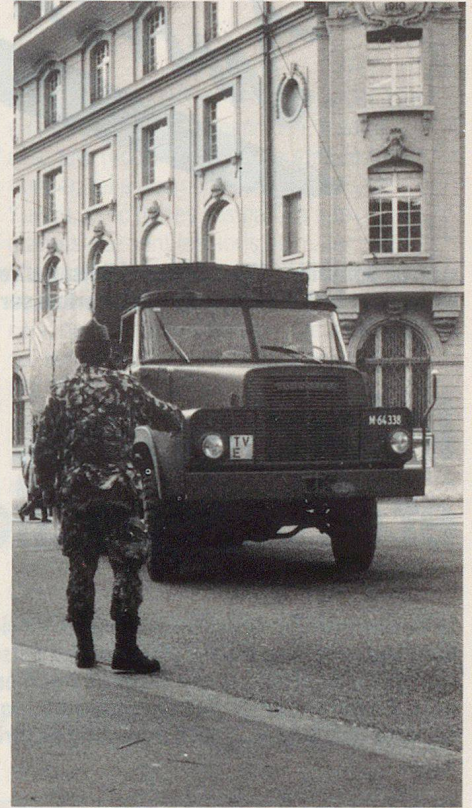
Ex DG 88: une image inhabituelle de Berne.