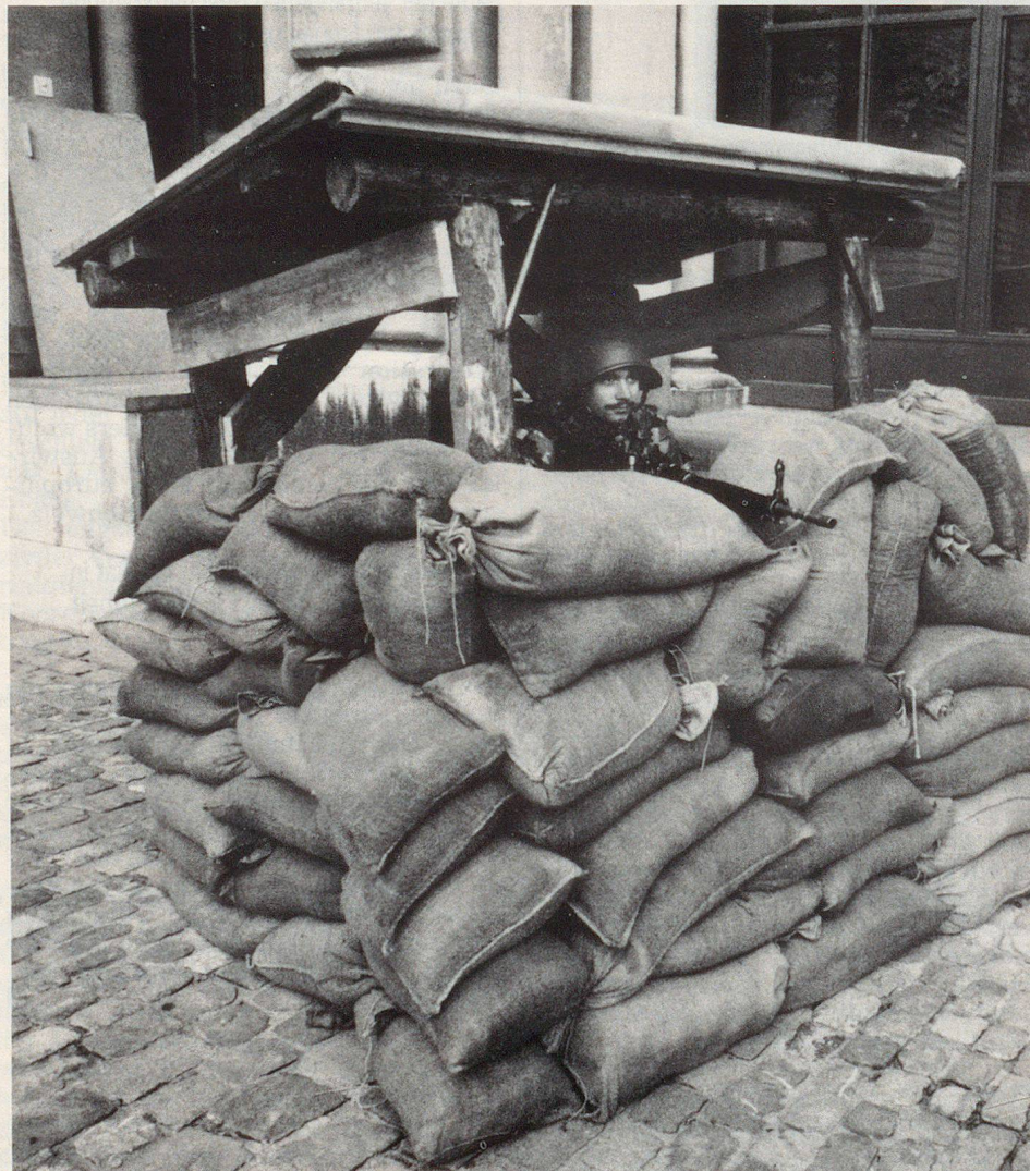
Est-ce vraiment si sérieux?

comme telles des personnalités qui participent au processus de décision dans des situations extraordinaires (tous les cas stratégiques, à l'exception du cas normal de «paix relative») et comment elles accomplissent leurs tâches, chacune dans le cadre de son département et de son office, ou de la direction de l'armée. Il s'agit en particulier d'appré-