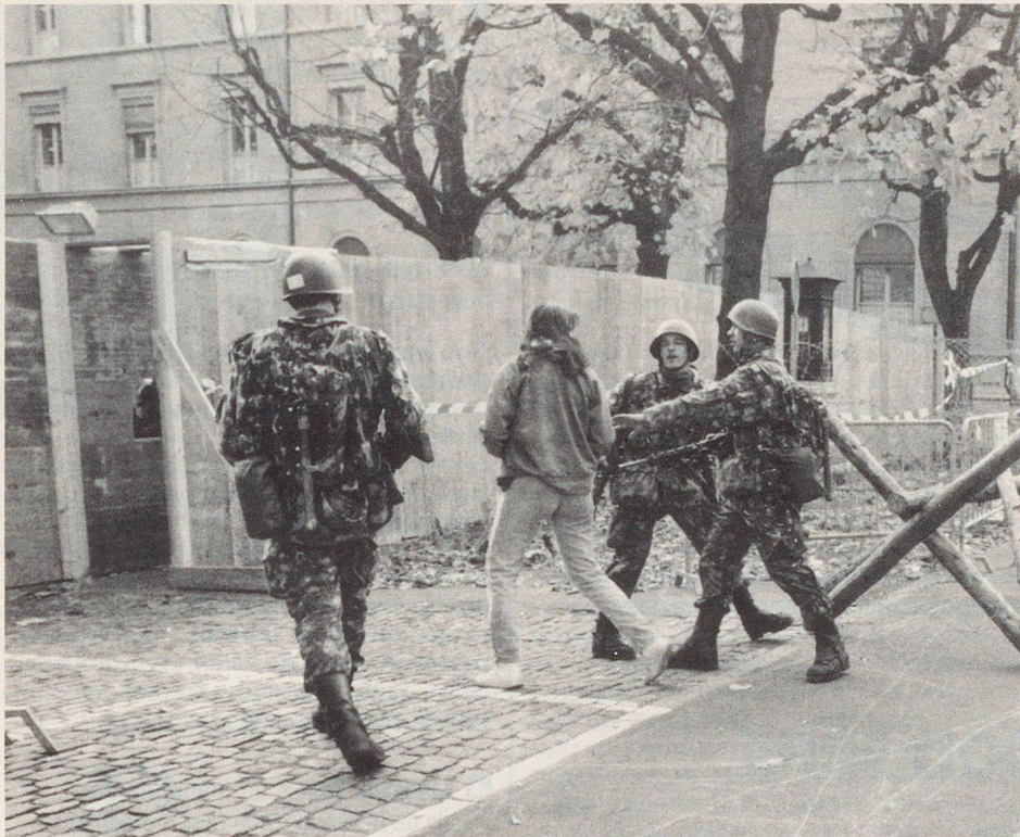
Rencontre de deux mondes durant l'Ex DG.