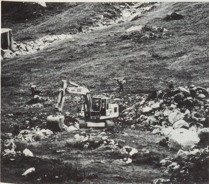
Kultur und Weideland wird von Geschiebe, Geröll und Felsbrocken befreit.

Abschliessend möchte ich festhalten, dass der Einsatz für alle ZS-Pflichtigen durchwegs als lehrreich beurteilt werden kann. Lehrreich für das Kader auf allen Stufen, das laufend mit Lagebeurteilung, Entschlussfassung und Befehlsgebung konfrontiert war. Lehrreich für die Mannschaft, die in unwegsamem Gelände Material und Werkzeuge zum Einsatz bringen musste. ▀