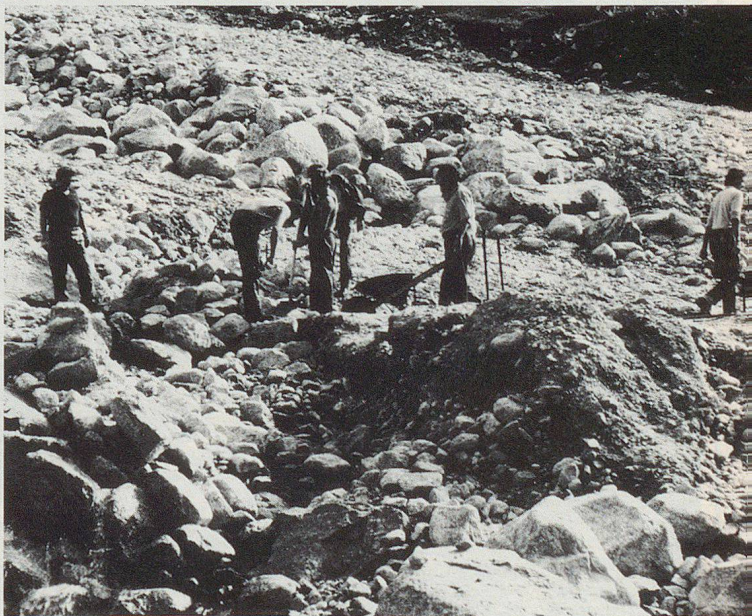
Der vom Unwetter ausgespülte Winterweg zur Göscheneralp wird saniert.