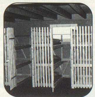
Kellerverschläge aus Schutzraumliegen BK 86

Wenn Sie unser schockgeprüftes Schutzraumsystem interessiert, rufen Sie uns einfach an.