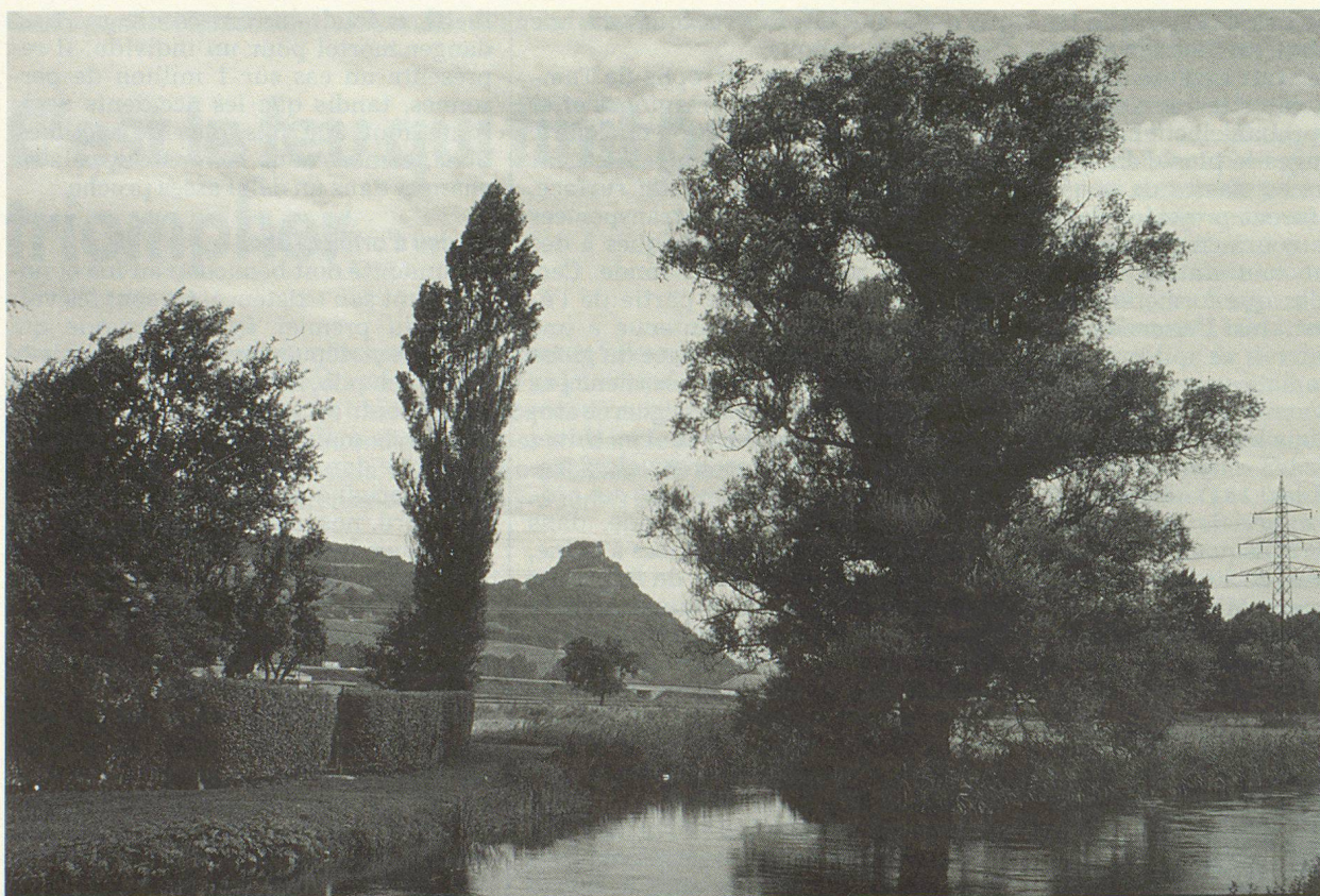
La forma dei vulcani dello Hegau presso Singen nella Germania meridionale ci ricorda che erano ancora attivi non molto tempo fa.

Quale minaccia costituiscono gli incendi provocati dalla natura?