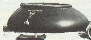
Einsatz im Katastrophengebiet/Intervention dans la région de sinistre