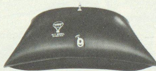
Wasserversorgung Ravitaillement en eau