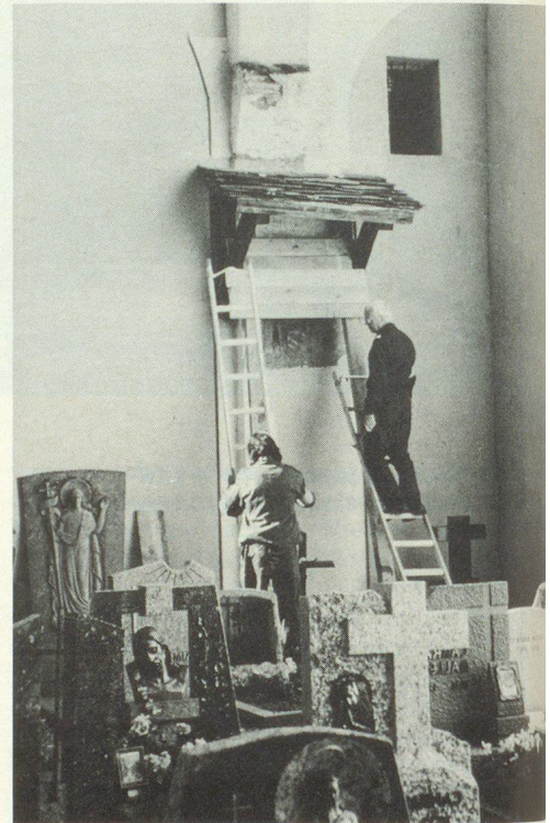
Unbewegliches Kulturgut wird an Ort und Stelle geschützt.

Anlässlich einer Übung im Zivilschutz stellt der Gemeindegewerkschaftsbeauftragte für den Kulturgüterschutz (Dienstchef Kulturgüterschutz) Massnahmen zum Schutze von Kulturgut vor, die in seiner