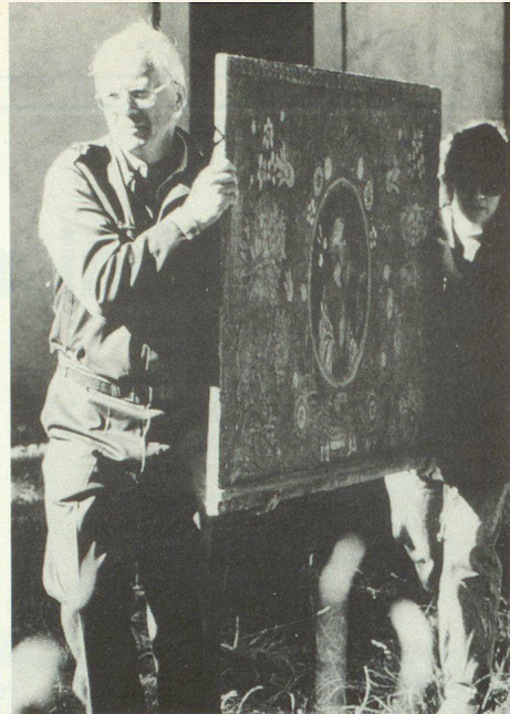
Evacuation de biens culturels.

Ce soir, l'assemblée communale va se réunir dans la salle du restaurant du village. Elle doit décider de la construction d'une nouvelle maison communale comportant, en annexe, un abri public et un poste de commandement. Pendant qu'on prépare la salle, des discussions se nouent entre l'électricien, le chef local, le chef de l'office de la protection civile, l'aubergiste et le syndic. Leurs propos portent sur les tâches de la commune dans la protec-