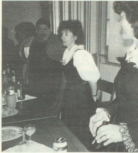
Enfin, la dégustation d'un apéritif bienvenue.

Au terme d'un succulent repas, servi au restaurant de l'Union, l'assemblée s'est