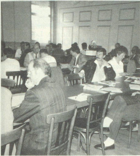
Une partie de l'assemblée durant les débats.

Le préfet de la ville de Bienne a évoqué un historique de la ville et de ses habitants à l'occasion d'un sympathique apéritif offert par la Municipalité et servi par le caviste en personne entouré de gentes dames en costume folklorique.