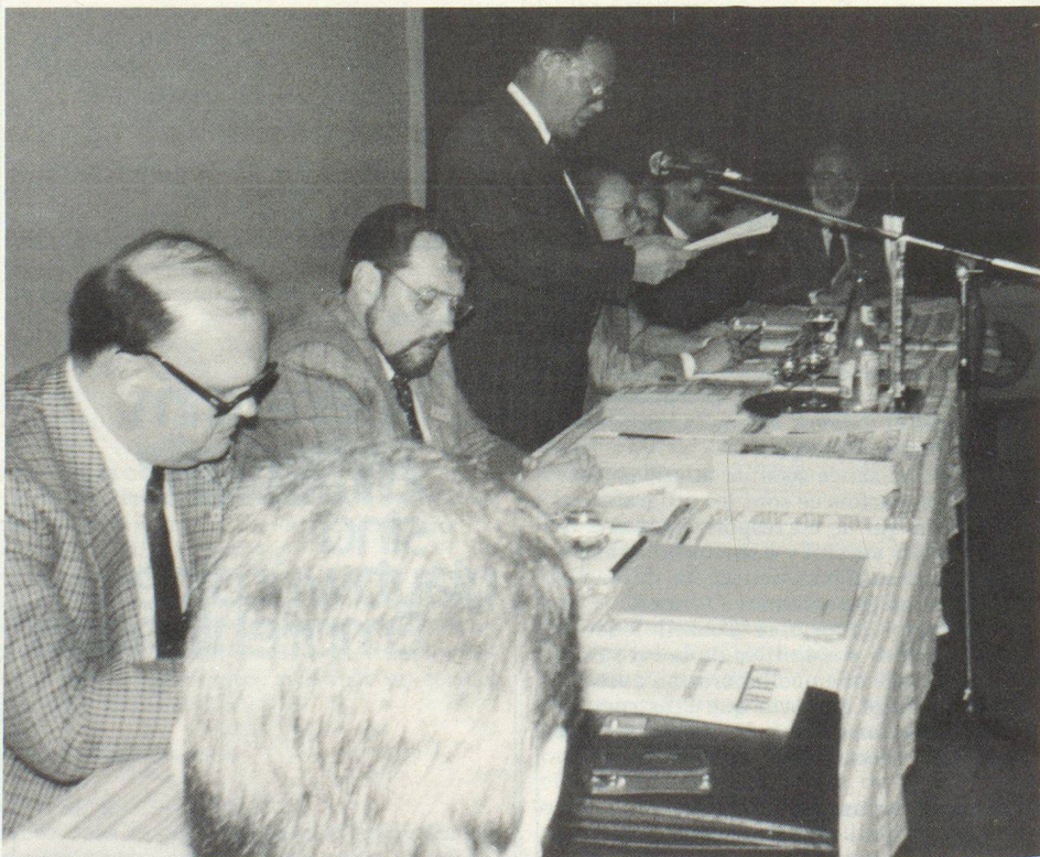
Le rapport présidentiel retient l'attention.