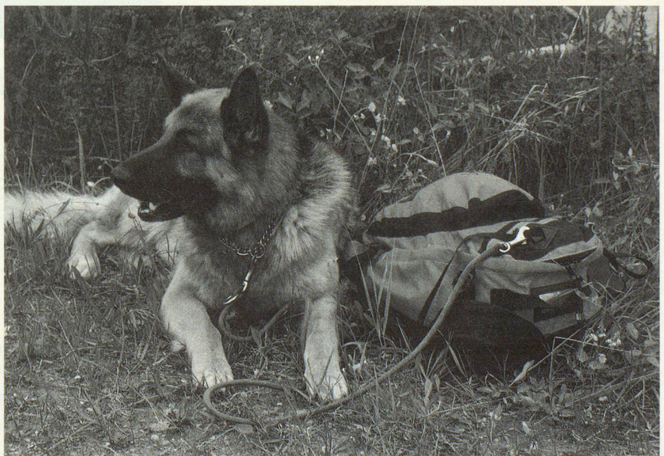
Stimmungsbild, wer passt da wohl auf wen auf? Ob der Rucksack auf sein «Anhängsel» oder ob der Vierbeiner auf das Gepäck seines «Chefs», kurze Musseaugenblicke zwischen Stress und viel, viel Suchen.

frastruktur (Übernachtungsmöglichkeit, Verpflegung für Helfer, Transporte) in den Händen des Ehepaares Sirkka und Urs Pfister aus Weiningen genau richtig lagen. Pfisters haben ein ausserordentlich feines Gespür, wann sie wo mit was aufzutauchen haben. Ohne den vollen Einsatz von solchen Hintergrund-«Heimchen» wäre eine derartig grossangelegte Übung