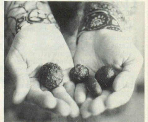
Steine die vom Himmel fallen: Zum Glück sind die meisten Meteoriten nur klein – grosse Brocken könnten weltweite Verheerungen anrichten.