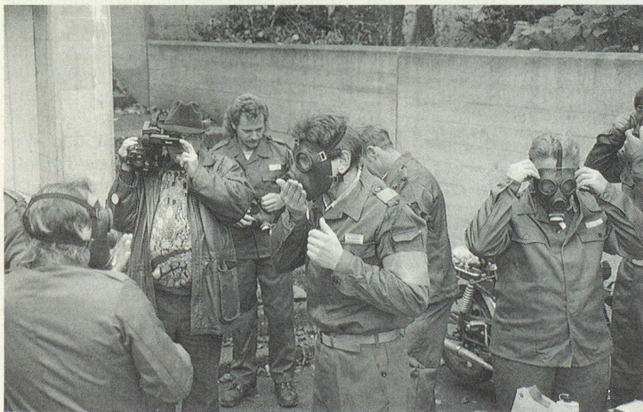
Auch im Zivilschutz eine Selbstverständlichkeit: das Erstellen der persönlichen AC-Schutzbereitschaft nach dem Einrücken.