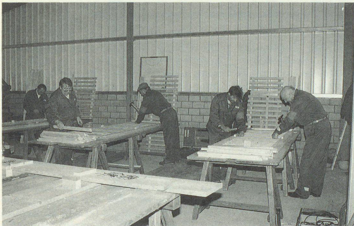
Ein Hauptziel der Übung: Bau von Liegestellen für die Privat-Schutzräume, anschliessend ein Schutzraumbezug mit der Bevölkerung.