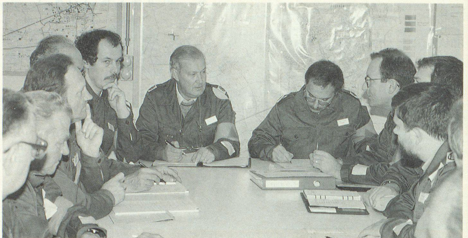
Die Ortsleitung Romanshorn im Einsatz: Viele ungewohnte Probleme galt es zu lösen.

Die Hauptphase der GVU, im strategischen Krisenfall, hat akute und zum Teil neue Personalprobleme aufgezeigt. Geplante Regelungen (Aktivdienstdispensationen usw.) konnten nicht in Kraft treten, weil keine Allgemeine Kriegsmobilmachung stattfand. Vor allem im Bereich Feuerwehr traten gros-