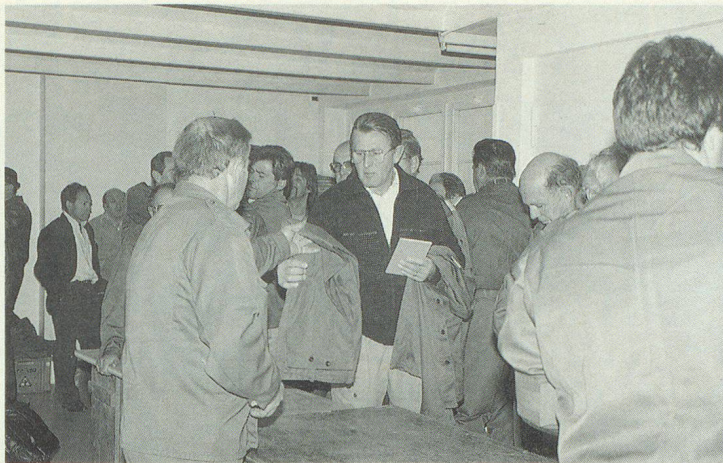
Gesamtaufgebot der Zivilschutzorganisation Romanshorn: gestaffeltes Einrücken der Übungsteilnehmer.