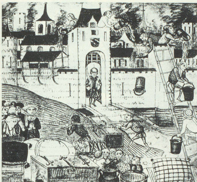
Die häufigste, aber auch verhängnisvollste Katastrophe in der mittelalterlichen Stadt im Krieg oder im Frieden ist die Feuersbrunst. Hier im zeitgenössischen Bild der Brand von Bern 1405, der praktisch die ganze Stadt in Schutt und Asche legte. Die Frauen und die Kinder sind aus der Stadt geflohen, und das Bild zeigt eindrücklich, mit welcher unzulänglichen Mitteln die in der Stadt verbliebenen Männer das Feuer bekämpfen.

sammen und begraben weitere Menschen unter ihren Trümmern. Weitere Erdstöße folgten unaufhörlich; es war, als ob die Erde überhaupt nicht mehr zur Ruhe kommen wollte.