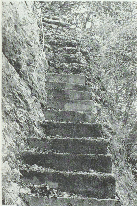
Nicht gesicherter Weg.