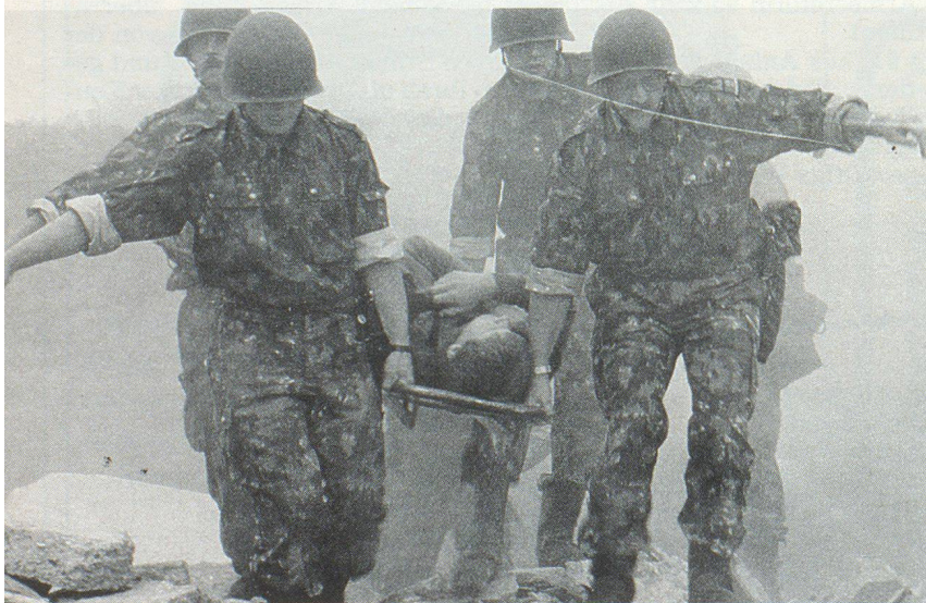
Rettingsaktion der Luftschuttsoldaten. Action de sauvetage des soldats de la protection aérienne. Un'azione di salvataggio delle truppe di protezione aerea.