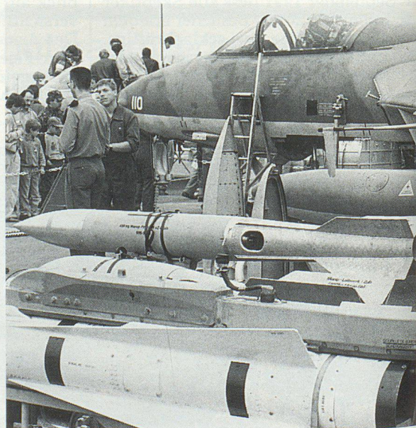
Hunter mit Waffenarsenal. Le «Hunter» et son armement. Un Hunter e il suo arsenale di armi.