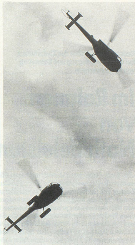
Ballett der Helikopter. Ballett d'hélicoptères. Il balletto degli elicotteri.