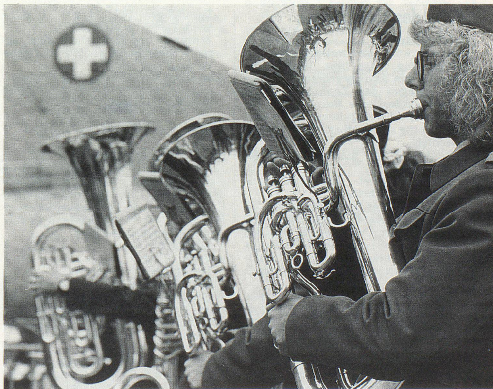
Das MFD-Spiel ad hoc. La fanfare du SFA. Per l'occasione ecco il gruppo musicale del SMF.