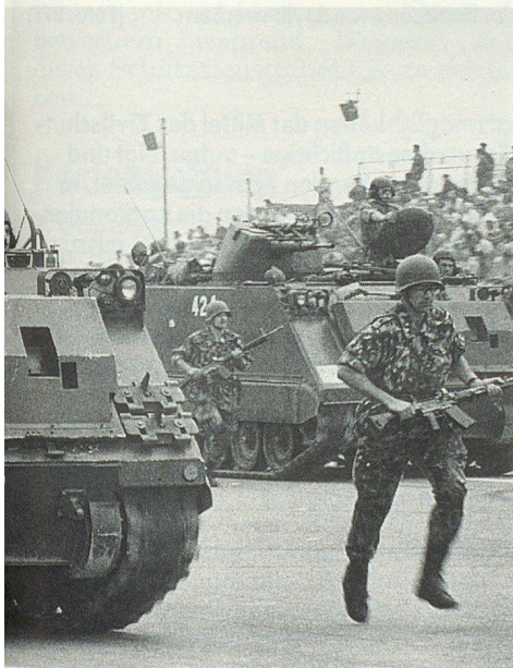
Panzergrenadiere stürmen heran. Grenadiers de char à l'attaque. Granatieri dei carri armati all'attacco.