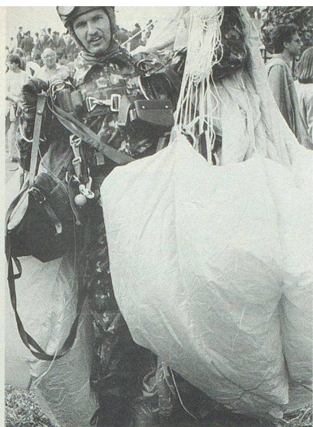
Fallschirmjäger in voller Montur. Les chasseurs parachutés complètement équipés. Paracadutisti con l'equipaggiamento completo.