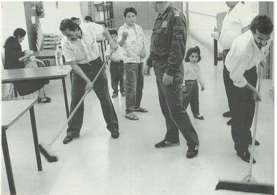
Collaborer à l'assistance aux requérants d'asile: une nouvelle tâche confiée à la protection civile.

Ainsi débute la circulaire adressée récemment aux offices cantonaux de la protection civile et aux départements cantonaux chargés de la prévoyance sociale par MM. Hans Mumenthaler, directeur de l'Office fédéral de la protection civile, et Peter Arbenz, directeur de l'Office fédéral des réfugiés. La circulaire présente les