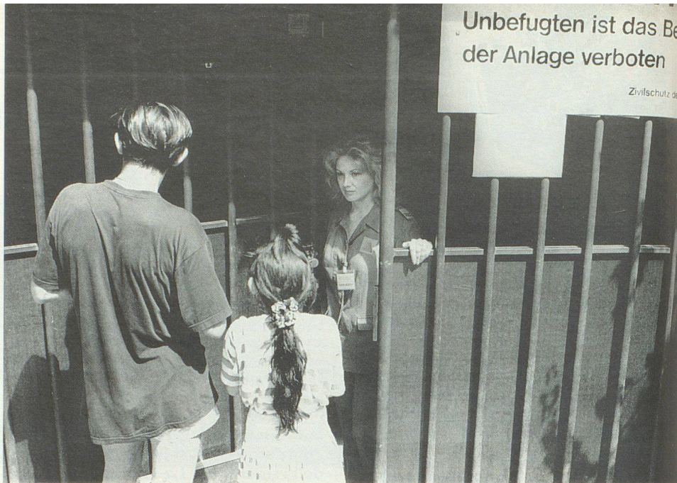
Neue Aufgaben für den Zivilschutz: Mithilfe bei der Betreuung von Asylbewerbern.