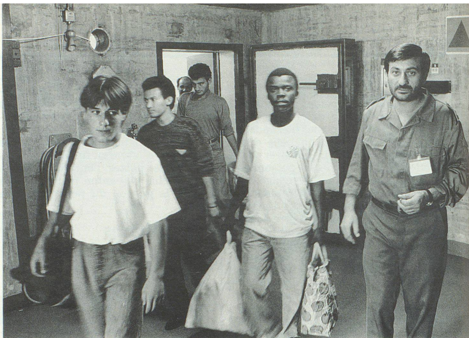
Nuovi compiti per la protezione civile: collaborazione all'assistenza dei richiedenti l'asilo.