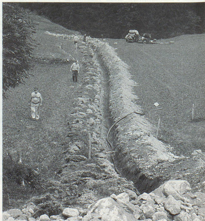
Endlich genügend und besseres Wasser dank einer in den Boden verlegten Wasserleitung.