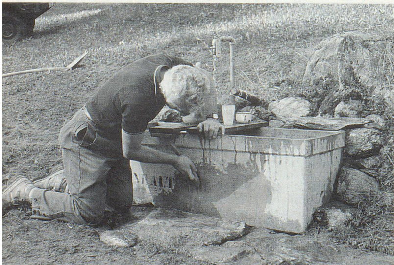
Am Endpunkt ein schmucker Brunnen.