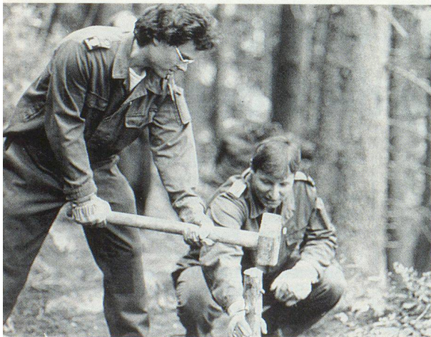
Die Männer der ZSO Kilchberg mussten recht ungewohnte Arbeit verrichten. Doch sie leisteten diese mit Freude und grossem Einsatz.