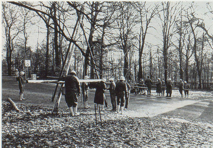
Tiendra, tiendra pas!; préparation de la traversée de route.

Les missions étant bien distinctes, la collaboration n'a pu être exercée que partiellement. De prochains exercices devraient permettre à chacun des intervenants de mieux se connaître et de renforcer ainsi la coopération à tous les niveaux. ▲