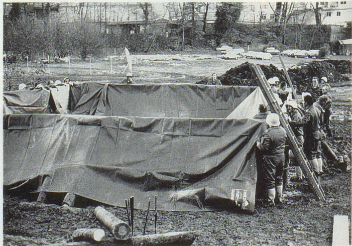
Du doigté pour la construction du bassin de 100 000 litres.