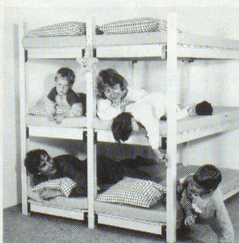
WISTHO-Schutzraumliegen sind 100% schweizerisch: Holz, Patent, Verarbeitung, Vertrieb

Mitglied der Interessengemeinschaft WISTHO WISTHO AG, Steinhausen (ZG), WIRTH Holzbau AG, Schwanden (GL) Kander Paletten und Holzwerk AG, Reichenbach (BE)