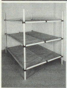
Dreier- und Sechserliegen

Kellergestell in Friedenszeiten. Bequeme Liegestelle im Katastrophenfall, dank integrierter Tuchliegende ist KEINE MATRATZE notwendig.