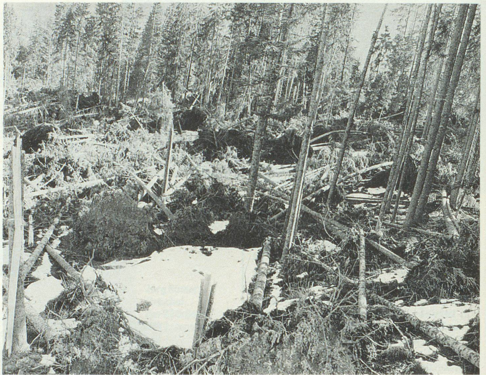
Im Bergwald der Entlebucher Gemeinde Flühli entstanden viele Flächenschäden. Auch wenn alle diese Schadenplätze geräumt werden, braucht es noch viel Geduld, bis der Wald sich wieder erholt hat.

Weil auch am Pilatus-Nordhang grosse Waldschäden der Behebung bedürfen, wandte sich die ZSO Luzern an 650 Eingeteilte der ZS-Mehrzweckdienste mit der Anfrage, ob sie auf freiwilliger Basis bereit wären, sich für Waldräumeinsätze zur Verfügung zu stellen. Und siehe da! Es meldeten sich 136 Freiwillige. Da soll noch einer behaupten, Zivilschutzpflichtige wären für sinnvolle Einsätze nicht motivierbar.