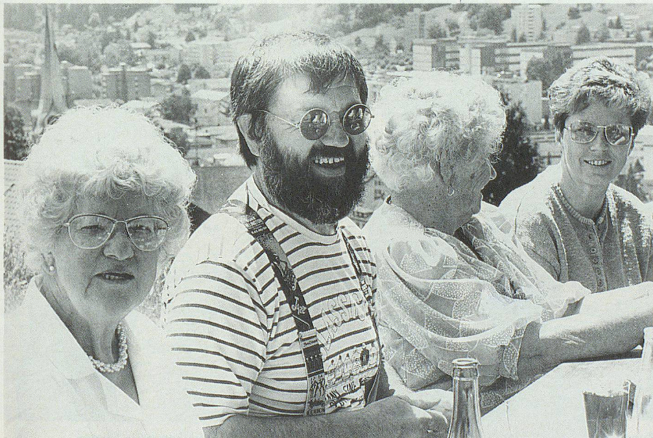
Kontakt zwischen Zivilschützern und Senioren.