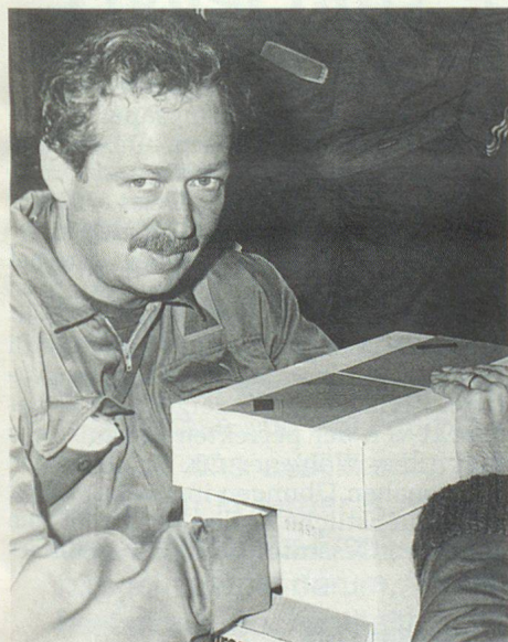
Prüfung der Sinne. Was wohl in dieser Schachtel enthalten sein mag?