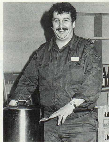
Eine mit Überlebensnahrung angereicherte Suppe wird schmackhafter und nahrhafter.

Im Schreiben an die Zeitungen hiess es weiter, den Behörden sei zu Ohren gekommen, dass die ULN praktisch ungeniessbar sei. Aufgrund von Aussagen also ist entschieden worden. Jegenstorf's Gemeindeführer, die sich auch über eine vom Kanton vorbereitete