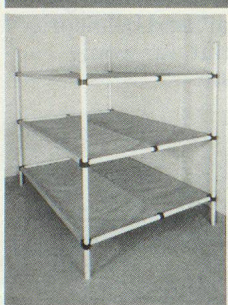
Dreier- und Sechserliegen

Kellergestell in Friedenszeiten. Bequeme Liegestelle im Katastrophenfall, dank integrierter Tuchliegende ist KEINE MATRATZE notwendig.