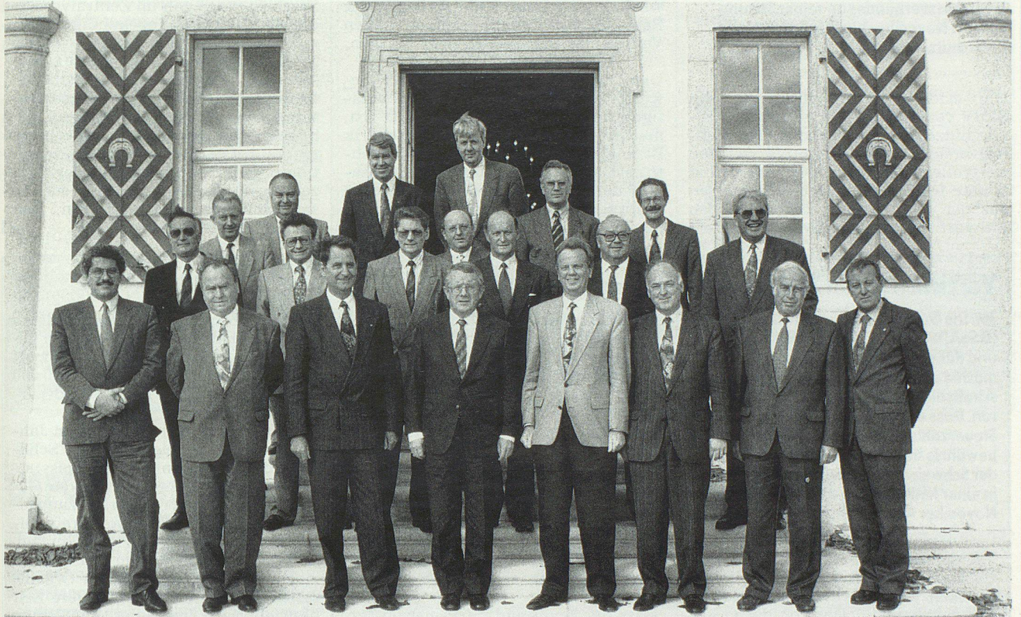
Die Tagungsteilnehmer vor dem Schloss Waldegg, wo die Jahresversammlung durchgeführt wurde.