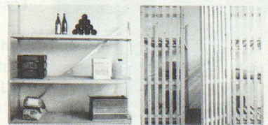
Mehrzweck-Schutzraum-Liegestellen, die Sie mit wenigen Handgriffen zu Lagergestellen, Keller- oder Estrich-Trennwänden umbauen können.