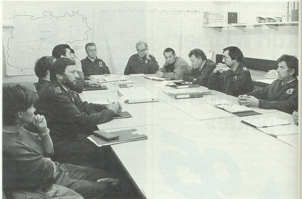
Lagebesprechung auf dem Kommandoposten.

Wurden am ersten Übungstag Ereignisse eingespielt, die mit den zivilen Mitteln wie Feuerwehr, Bauamt und Samaritern zu bewältigen waren, so mussten am zweiten Tag die Zivilschutzorganisationen aufgerufen werden. Eine Menge von phantasievollen Einlagen wie die Bergung abgerutschter Fahrzeuge, die Räumung verschütteter Strassen und Hangverbauungen hielten die Zivilschutz-Angehörigen während zwei Tagen und der dazwischen liegenden Nacht auf Trab. In einer Gemeinde konnte eine dort stationierte Rekrutenkompanie voll in die Übung integriert werden. Die übungsleitenden Gemeinden entwickelten viele gute Ideen; in einem Fall wurden die Ereignisse stündlich über ein Radio «Domino» eingespielt. Das Übungskonzept wird im Jahre 1992 mit vier anderen Gemeinden weitergeführt. ▀