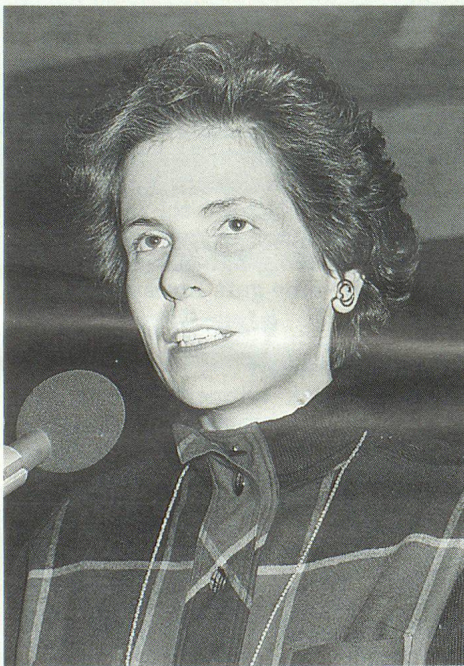
Ständerätin Christine Beerli: «Unser Milizsystem bedarf der Neuorganisation.»

Das Nehmen komme vor dem Geben, der Einzelne stehe vor dem Ganzen. Heute sei ein rasanter Schwund an organischer Übereinstimmung und eine galoppierende Erosion kollektiv bindender Orientierungen festzustellen. Auch im staatspolitischen Bereich mache sich die schweizerische Sonderfallausgestaltung immer stärker bemerkbar, im Obstruktionspotential und im Referendumswucher, in den langen Entscheidungsprozessen und der mittleren Unzufriedenheit der Kompromissmaschinerie und schliesslich in den Leistungs- und Rekrutierungsschwächen des Milizsystems. «Wie lange können wir uns so viel Mittelmasse noch leisten?» fragte Christine Beerli. Um alsdann festzustellen, dass das schweizerische Milizsystem in den letzten Jahrzehnten wohl seine Grenzen nach oben durchstossen habe. Zur Steigerung der Effizienz und zum Vermeiden von Frust sei das Milizsystem daher so zu organisieren, dass nicht jeder nichtprofessionelle Mandatsträger «das Rad neu erfinden müsse.»