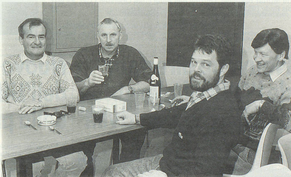
Die Küchenmannschaft bei einer wohlverdienten Pause. Dazu gehört auch ein währschaftes Entlebucher «Kafi».