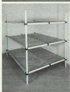
Dreier- und Sechserliegen

Kellergestell in Friedenszeiten. Bequeme Liegestelle im Katastrophenfall, dank integrierter Tuchliegefläche ist KEINE MATRATZE notwendig.