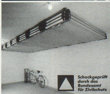
Schockgeprüft durch das Bundesamt für Zivilschutz

Vormontierte Lagerung an der Schutzraumdecke Optimale Raumnutzung in Friedenszeiten, sofortige Einsatzbereitschaft mit wenigen Handgriffen, einfaches Stecksystem, ohne Werkzeug.