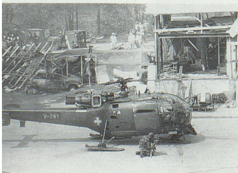
Les teams de chiens de catastrophe arrivent en hélicoptère sur le terrain du dommage.