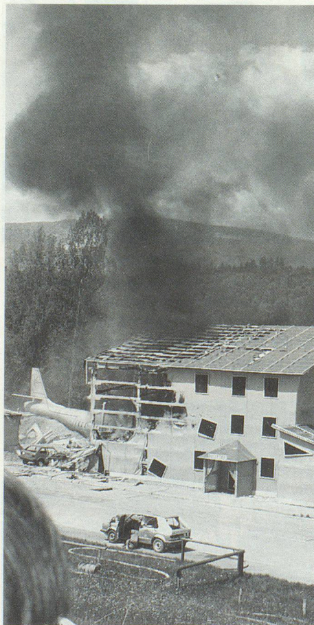
Des colonnes de fumée montent au ciel.

rei. La chute d'un avion dans une zone habitée. Un enfer de détonations, de flammes et de fumée âcre, des personnes ensevelies et blessées – ceci fut le scénario de la démonstration de sauvetage de cette année sur le terrain de la place d'armes de Wangen sur les bords de l'Aar.