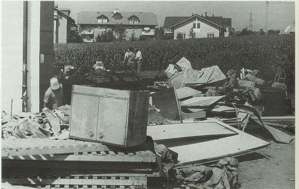
Nach dem Unwetter türmen sich Abfallberge vor den Häusern.

Auch andere Gebiete des Kantons Luzern waren heimgesucht worden. Doch die Gemeinde Inwil hatte es besonders stark getroffen. Innert weniger Stunden fiel ein Zehntel der üblichen Jahresniederschlagsmenge. Die Kanalisation vermochte die Wassermassen nicht mehr zu schlucken und die Bäche, mit Geschiebe, Astwerk und Bäumen verstopft, traten über die Ufer.