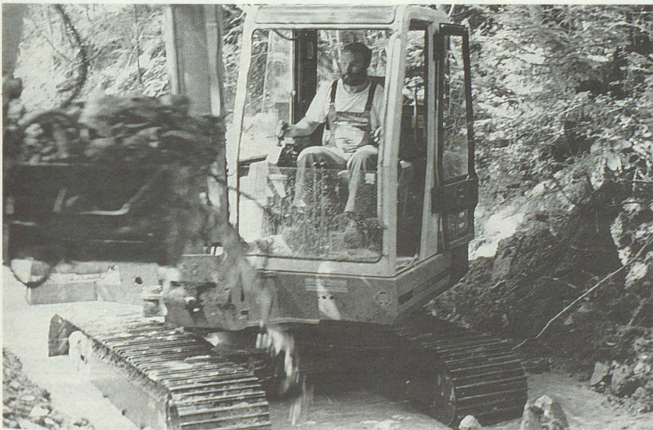
Die Bachläufe werden vom Geschiebe befreit.

Als erstes wurde in einem erst vor wenigen Jahren erbauten Quartier die Einstellhalle überflutet und ein rundes Dutzend Personenwagen versanken in den Wassermassen. Die Keller von Privathäusern, die sich mit Wasser füllten, waren bald nicht mehr zu zählen. Auch das Untergeschoss des neuen Inwiler Schulhauses wurde überflutet. Der Proberaum der Musikschule, Werk- und Bastelräume samt Mobiliar und das Gemeindearchiv mit vielen unersetzlichen Schriften wurde von den Wassermassen fortgeschwemmt.