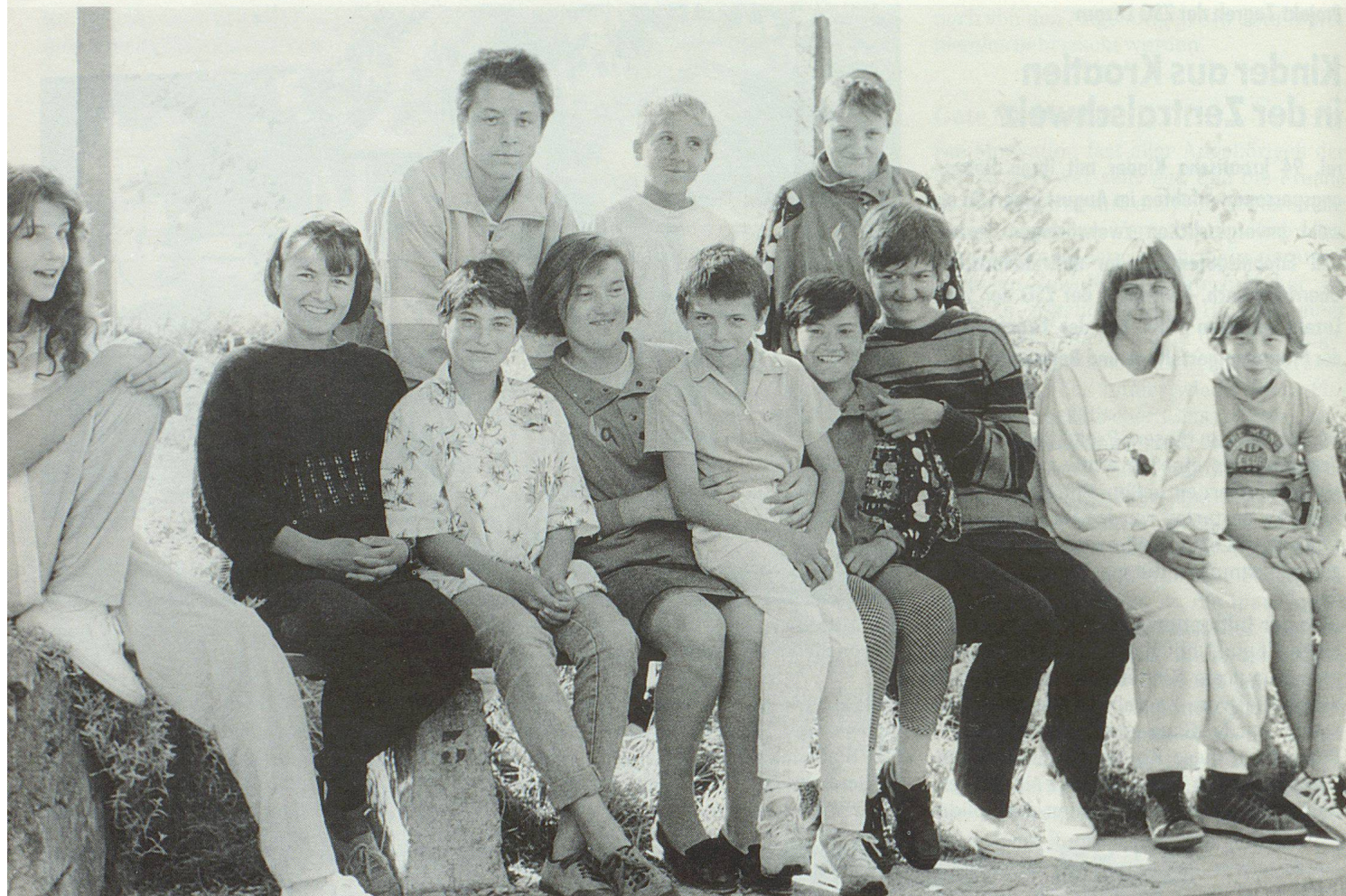
Den Fotoapparat gezückt, und schon versammelten sich einige zum Gruppenbild.

brachte auf diese Weise das Geld für die Reise zusammen und viele Privatpersonen boten ihre Hilfe an.