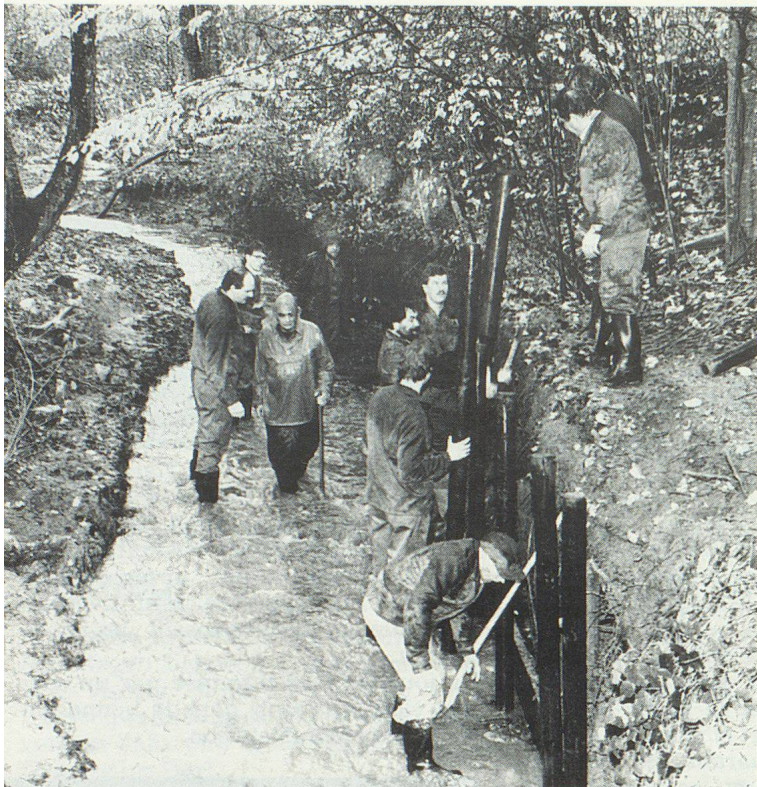
Von unten und von oben nass. Doch die Thurgauer liessen sich nicht entmutigen.