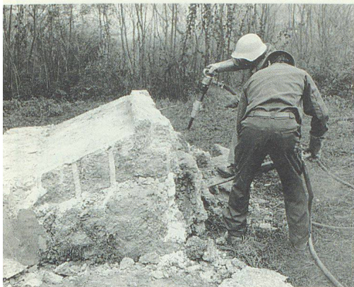
Gute Arbeit war schon beim Bau der Brückenfundamente geleistet worden. Gute Arbeit erforderte auch deren Beseitigung.