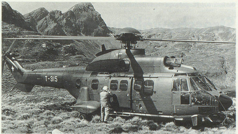
Auf dem Grener Berg gelangte der «Super Puma» der Armee zum Einsatz.

Neben dem Pionier- und Brandschutzdienst leistete der Versorgungs-Dienst (Küche) unter der Leitung von André Notter einen Grosseinsatz, war die Küchenmannschaft doch täglich von fünf Uhr morgens bis zehn Uhr abends im Einsatz. In der bestehenden Küche konnte jeweils nur das Essen für 50 Personen zubereitet werden, und so musste für die rund 120 Mann und fünf