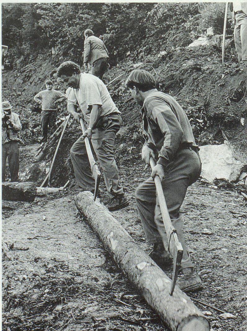
Schwere körperliche Arbeit am Bauplatz Axastai.