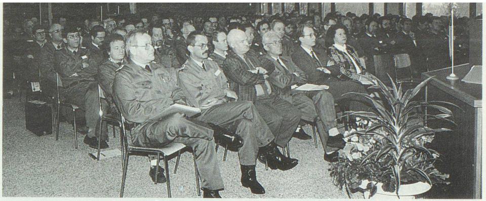
Plus de 180 cadres supérieurs de l'OPC ont participé à cette journée d'information.