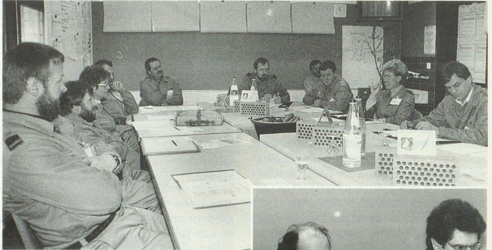
Phantasievoll und gemütlich gestaltete Klassenzimmer schufen auch äusserlich optimale Lernbedingungen.

Gleich zu Beginn wies die Kursleitung darauf hin, dass der Instruktorienkurs 1993/1994 ein wichtiges Element eines «neuen» Zivilschutzes sei. Neu erscheinen vor allem drei – stark miteinander verknüpfte – Aspekte: Erstens wird der situative, verstärkt partnerschaftliche Führungsstil – damit verbunden auch erwachsenengerechtere, flexiblere Umgangsformen – auch im Zivilschutz aufgewertet. Zweitens werden bewusst neue Instruktorien- und Lernformen ausprobiert. Sie beinhalten zum Teil spielerische, fast immer auch aktiv miteinbeziehende Elemente und kommen damit unterschiedlichen Lerntypen