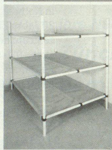
Dreier- und Sechserliegen

Kellergestell in Friedenszeiten. Bequeme Liegestelle im Katastrophenfall, dank integrierter Tuchliegende ist KEINE MATRATZE notwendig.