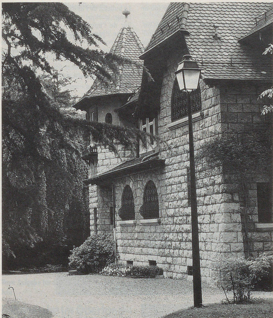
Le siège de l'OIPC.

tre Roland Dumas: depuis les élections, la concrétisation tarde.» Des contacts ont eu lieu en 1987, se rappelle Sadok Znaidi, par l'intermédiaire de l'ambassade ainsi que directement auprès de Hans Mumenthaler, alors directeur de