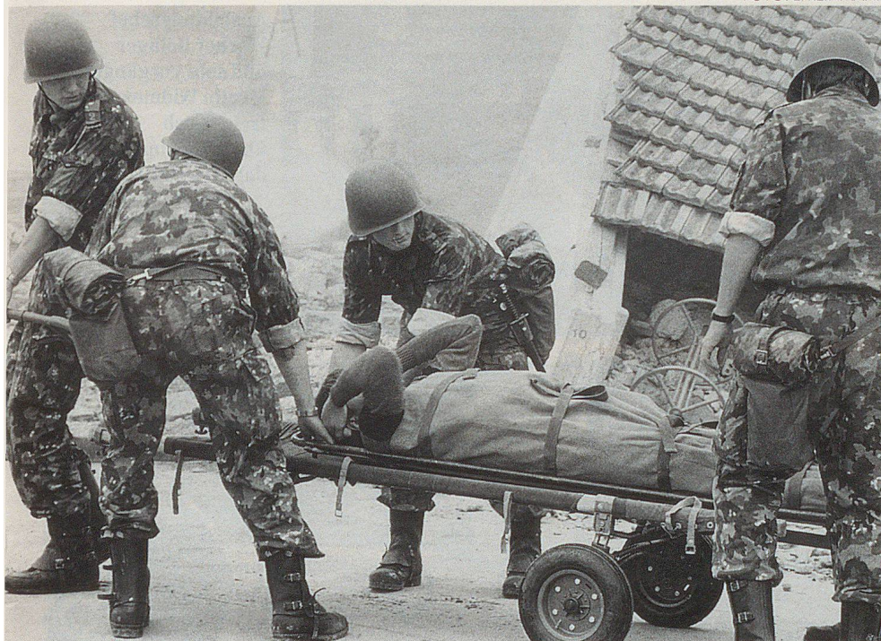
Le truppe di salvataggio sono addestrate ed equipaggiate per prestare soccorso in condizioni difficili.

ziale in caso di eventi gravi e molto estesi. Insieme agli strumenti civili si determina generalmente il seguente ordine di priorità degli interventi: