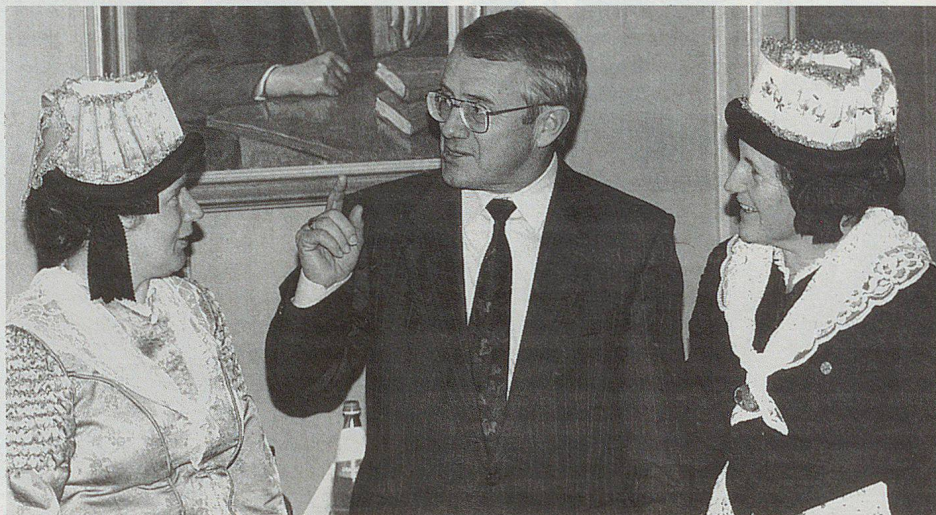
Le conseiller fédéral Arnold Koller en conversation animée à Brigue.

Des formations de la protection civile du Valais et de beaucoup d'autres cantons ont effectué pour remédier aux dégâts de la catastrophe de l'automne 1993, unique-